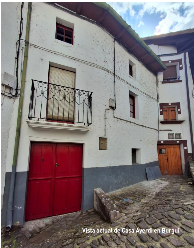
Vista actual de Casa Ayerdi en Burgui