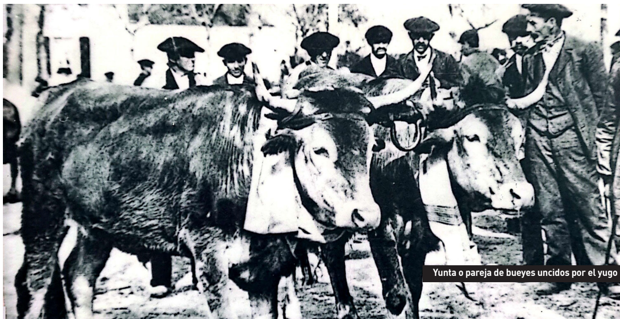
Yunta o pareja de bueyes uncidos por el yugo

Los trabajos se desarrollaban en diferentes etapas. Tras seleccionar los mejores pinos y abetos en los bosques eran talados en luna menguante para una mejor conservación de la madera. Una vez batidos y estajados (corte de las ramas) las cuadrillas se encargaban de bajar los troncos desde el bosque hasta los caminos donde quedaban almacenados. Estas labores resultaban muy peligrosas teniendo en cuenta que muchas veces los troncos rebasaban los 32 metros de longitud y más de un metro de diámetro. El 20 de mayo de 1669 al bajar un mástil una cuadrilla de hombres en la selva de Maze,