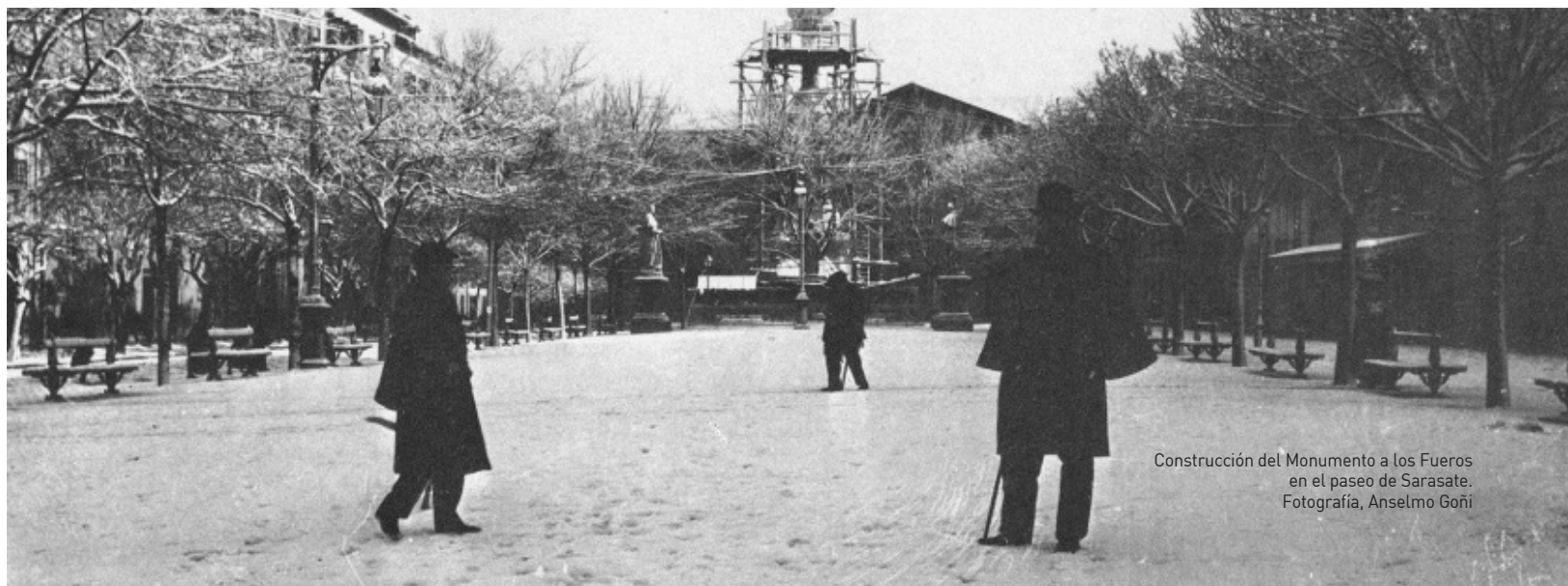
Construcción del Monumento a los Fueros en el paseo de Sarasate.

Ayuntamiento de Burgui Burgiko Aiza Bulgua