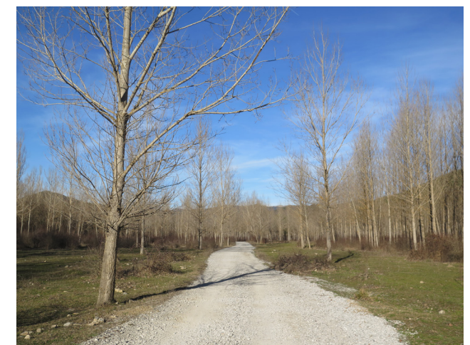
Vista actual de chopera en Los Sotos