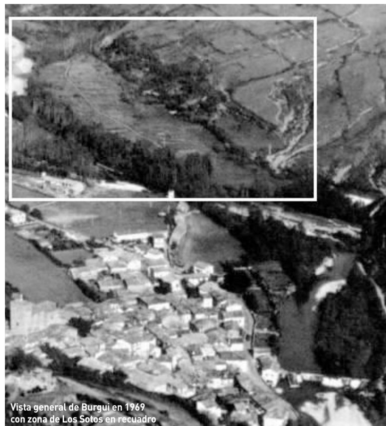
Vista general de Burgui en 1969 con zona de Los Sotos en recuadro

Agradecemos a Josexo Redín Fayanás la cesión de los documentos que han permitido resumir este proceso de inscripción de aprovechamiento de aguas.