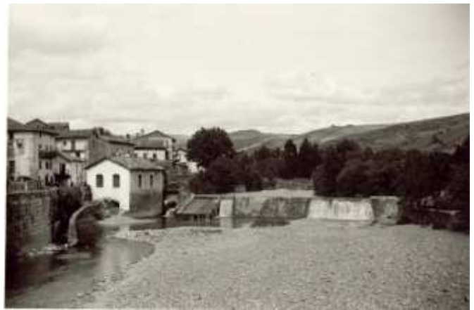
Vista de la presa y el molino a finales de los años 70