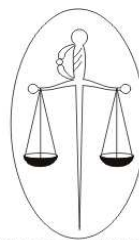
AYUNTAMIENTO DE LA VILLA DE BURGUI BURGIKO AIZA BULGUA

La construcción del nuevo frontón en cuya pared se iba a pintar el escudo de la villa provocó algunas peticiones de revisar la heráldica municipal, lo que forzó la sustitución del escudo que se estaba empleando, dando paso progresivamente, desde esa fecha, al escudo oficial del valle, tal y como lo usan en sus mimbres la Junta del Valle y el Ayuntamiento de Roncal. No obstante, todavía a fecha de hoy los impresos generados desde el ayuntamiento, así como el sello municipal, incorporan la balanza y la espada, símbolo de la justicia.