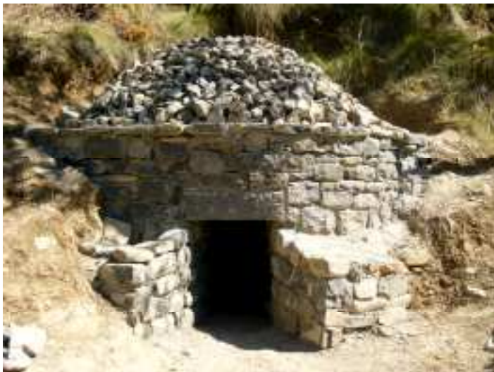
Calera reconstruida durante el verano en el camino a la foz

Atrás han quedado los trabajos de reconstrucción de una calera en Sitxea, o los trabajos de construcción de una cubierta bajo la que en un futuro se hará una carbonera, que van a venir a reforzar no sólo nuestro patrimonio local, sino también a nuestro pueblo como destino turístico, como pueblo de los oficios .